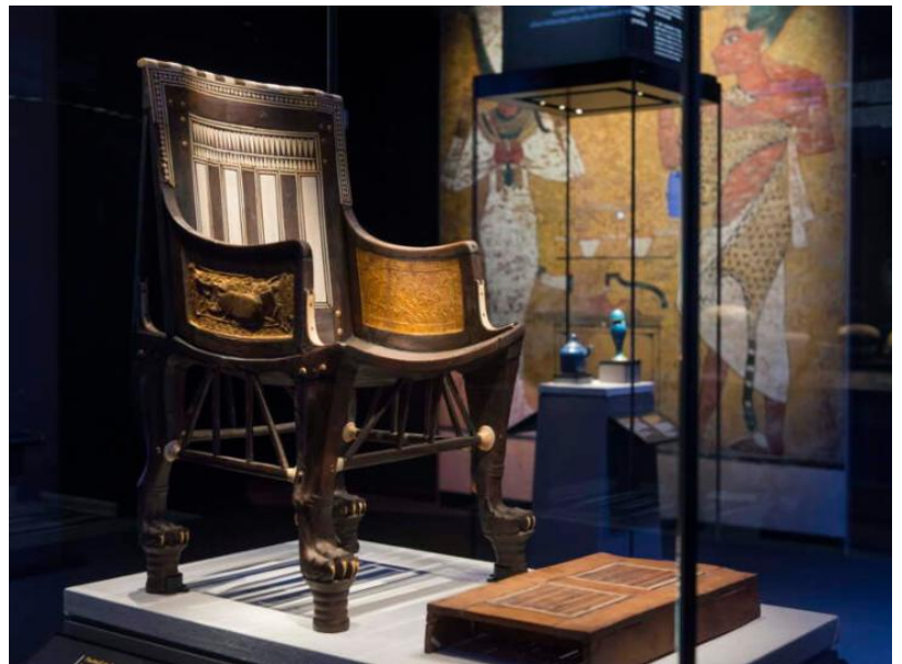
Petit fauteuil pour un jeune roi de 7ans.

Pectoral représentant une barque en or et un disque lunaire en argent avec contrepoids et chaîne. Or et Lapis-lazuli