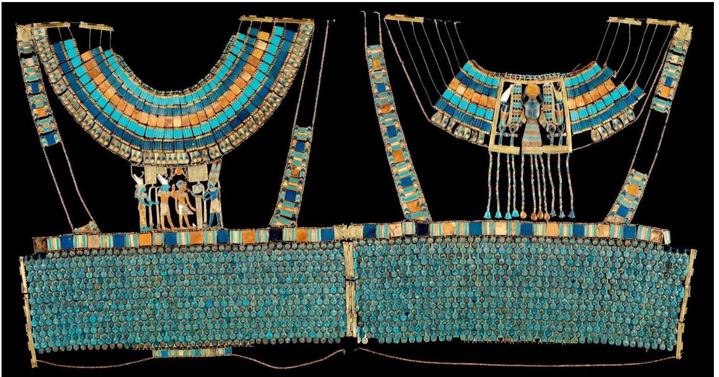
Le corselet du roi