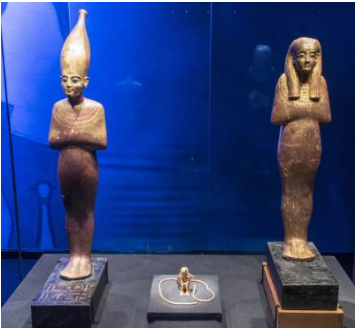
Statuette en or massif du roi Amenhotep III.