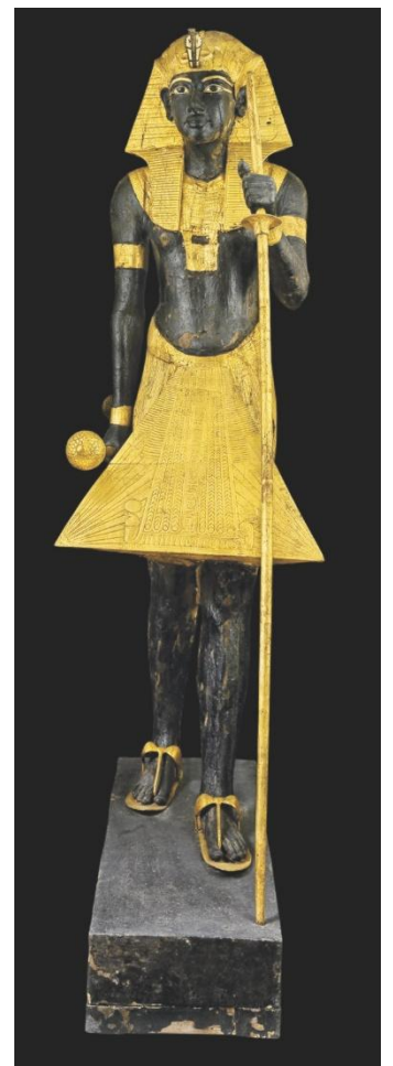
Statue grandeur nature