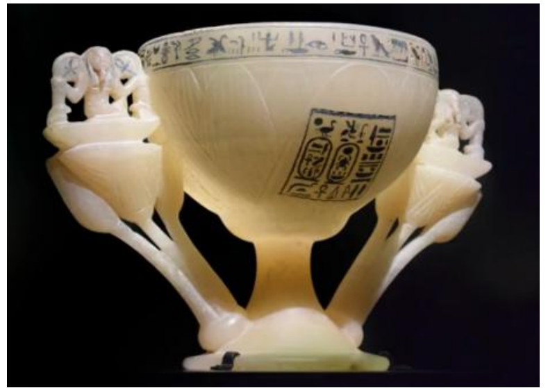
Vase en albâtre