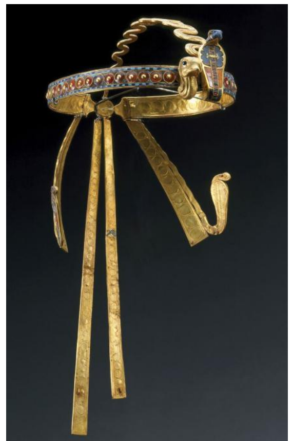
Diadème portant les symboles de la Haute-Egypte, et de la Basse-Egypte.